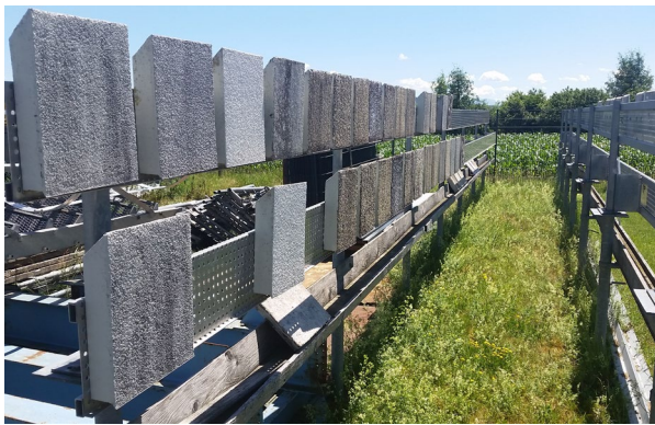
Freilandtesteinrichtung, Fraunhofer Institut für Bauphysik, Holzkirchen.

Forschungsinfrastruktur zur Bestimmung von baupraktischen Materialkennwerten und zur wissenschaftlichen Materialforschung sein. Konkret wird ein Implementierungsplan für ein bauphysikalisches Labor und eine Freilandversuchsfläche für die Materialbewitterung erstellt. Dadurch wird die Einführung eines fortschrittlichen ingenieurmäßigen Regelungsrahmens für eine energieeffiziente und nachhaltige Baupraxis unterstützt. Zudem werden Maßnahmen zum Kompetenzaufbau in verschiedenen Phasen des Gebäudelebenszyklus implementiert.